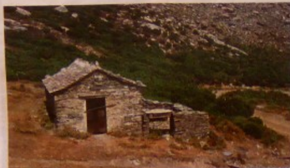
Bocca di San Giovanni : la petite chapelle au col.

Le départ de celui de San Giovanni peut se visiter aisément lors de la montée (ou descente) de la cima di e Follicie à l'aide d'un petit détour depuis le point de la deuxième traversée de la piste par le sentier de montée [1]. De ce point, on rejoint l'épingle à cheveux de Brondonaia, 500 m plus à l'est, d'où part une sente qui rejoint le ruisseau en 15 mn. Il suffit ensuite de descendre 250 m vers l'aval en visitant les étroitures pour parvenir à la cascade de 35 m au départ des difficultés. Retour par le même chemin.