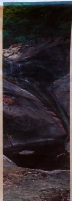
Canyon de San Giovanni : cascade au début du canyon.

110 Randonnées à pied et à VTT. Haute-Corse. Ed Glénat. Guide Multi-Evasion. 18,50 euros, 166 p.